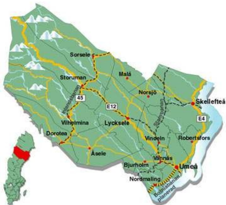
Figuvra 1: Maalege gielddas sajihus Västerbottena leanas

Manin lea válljen dán guovllu min akšuvdnaiskamii lea i) ahte vejolašvuohta čoaggit buriid dieđuid lea buorre, ja nuppi ii) ahte miellahtut Sámi čearus, geain leat iežas bohccut meastá dušše gielddas birra jagi, leat positiivvalaččat searvat iskamii. 2006 ledje sullii 11 boazodoallofitnodaga Maalege čearus. Maalege gielddas lea areála 1600 km 2 ja doppe leat sullii 3 500 ássit.